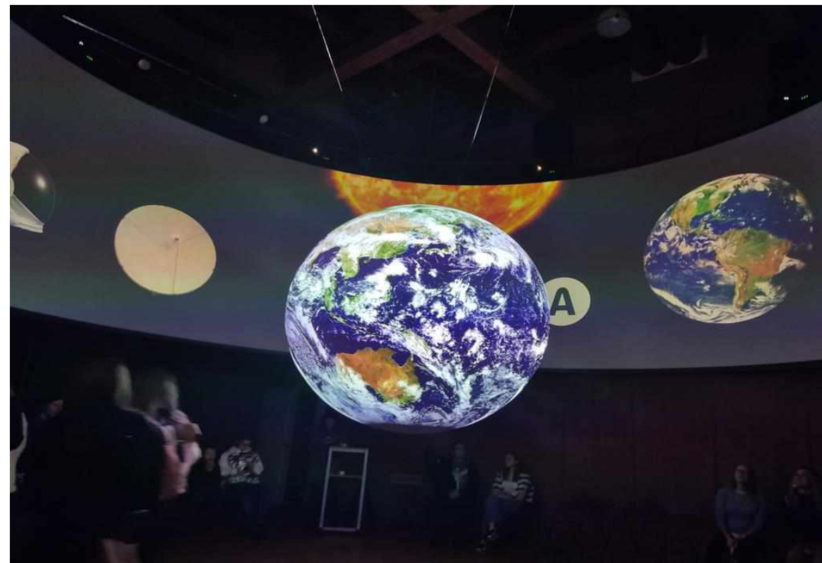
Inspirace - Sféra Pardubice