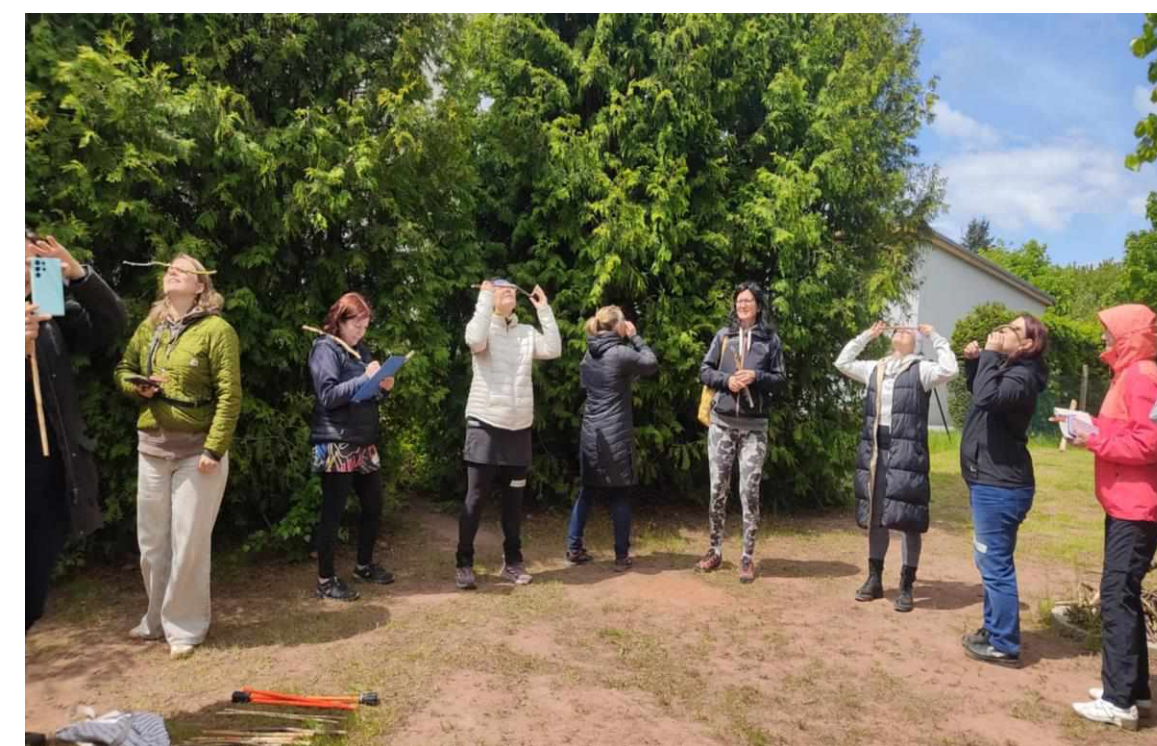
Nebojme se změny - Učení venku