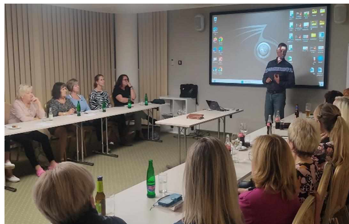
Inovujeme- Klub ředitelů